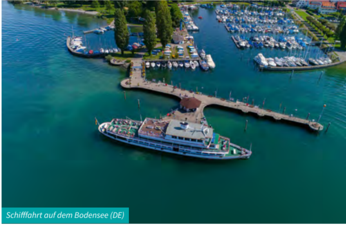
Schiffahrt auf dem Bodensee (DE)

* außer auf den Autofahren, der Strecke Konstanz – Radolfzell/ Schaffhausen, Hauptsaison und Feiertage