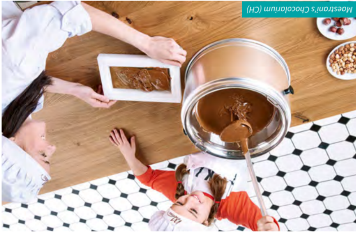
Maestran's Choccolarium (CH)