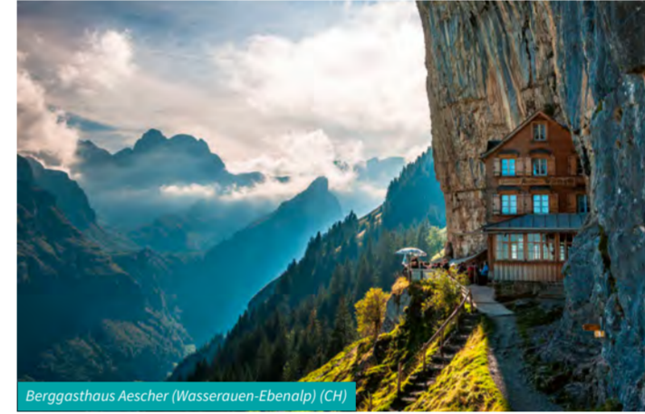
Berggasthaus Aescher (Wasserauen-Ebenalp) (CH)

Entdecken Sie alle Attraktionen online unter www.erlebnissplaner.eu/