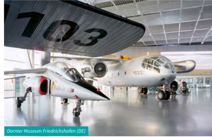
Dornier Museum Friedrichshafen (DE)

Deutschland, Österreich und die Schweiz teilen sich das Ufer des Bodensees, das kleine Fürstentum Liechtenstein liegt etwas rheinaufwärts. 173 km der 273 km Gesamtlängere gehören zu Deutschland, 72 km zur Schweiz und 28 km zu Österreich. Die Gesamtfläche des Sees beträgt 536 Quadratkilometer. Das kleine Fürstentum Liechtenstein passt mit seinen 160 Quadratkilometern also mehr als drei Mal in die Seefläche.